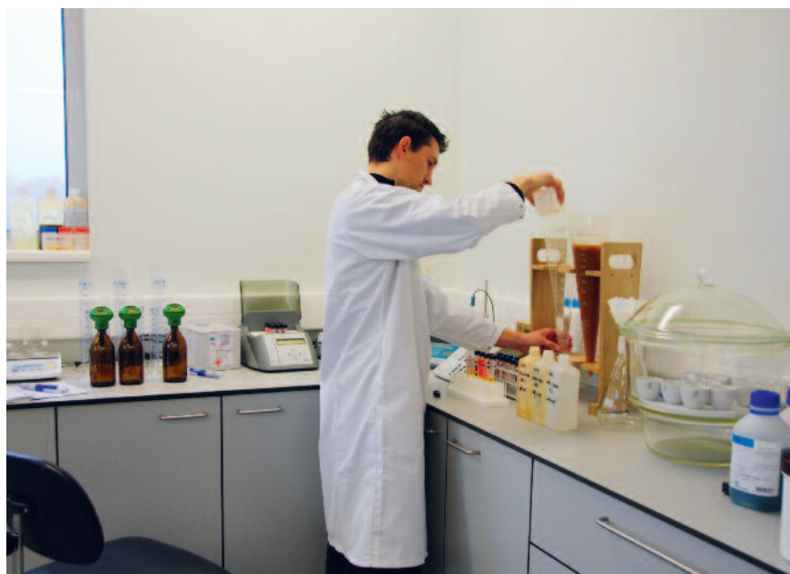
Enprotech heeft een eigen onderzoekslaboratorium, waar alle water- en slibanalyses worden uitgevoerd. De frequentie van die analyses is afhankelijk van de vraag van de klant en de noden van de installatie.