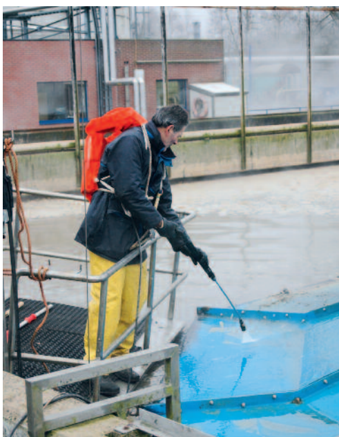
Het preventief technisch onderhoud wordt gebaseerd op een gedetailleerd onderhoudsplan.